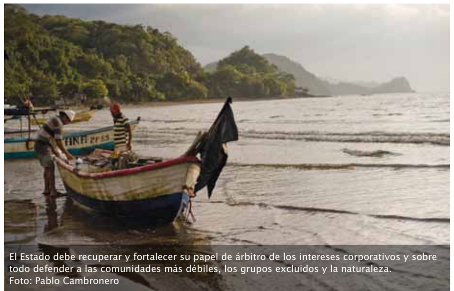
El Estado debe recuperar y fortalecer su papel de árbitro de los intereses corporativos y sobre todo defender a las comunidades más débiles, los grupos excluidos y la naturaleza.

Se espera que un manejo adecuado –con participación comunal y liderazgo institucional– de las Áreas Marinas de Pesca Responsable recupere la productividad de la pesca en el largo plazo y que además contribuya a mejorar la calidad de vida de las comunidades aledañas con los beneficios que reporta el desarrollo sostenible. Este tipo de esquemas de manejo, que combinan desarrollo y conservación, se convierten en un espacio de resistencia comunitaria frente a la lógica de exclusión y devastación que impone el capitalismo desenfrenado. La participación comunal –a partir de las necesidades y oportunidades de desarrollo que las personas escogen– asegura un compromiso moral más alto de los pescadores con los recursos naturales y permite también realizar tareas de investigación participativa mancomunadas entre los propios pescadores y los investigadores académicos. La conservación se entiende así como la base del sustento material de las vidas de las familias involucradas.