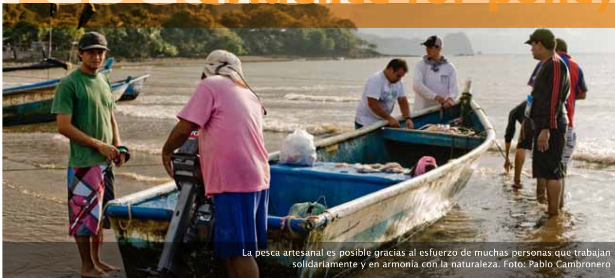
La pesca artesanal es posible gracias al esfuerzo de muchas personas que trabajan solidariamente y en armonía con la naturaleza.